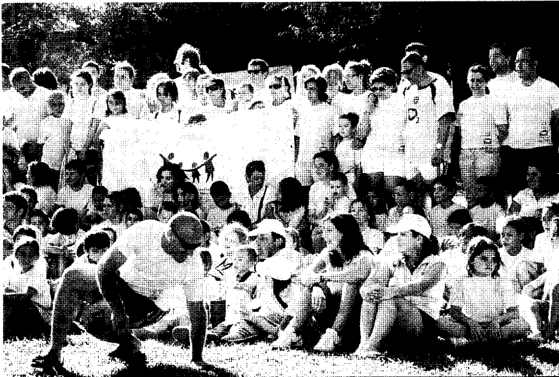
Foto de familia de los participantes en las jornadas.

SIERRA · LOS ACTOS SE HAN DESARROLLADO DENTRO DEL PROGRAMA DE 'SAFI'