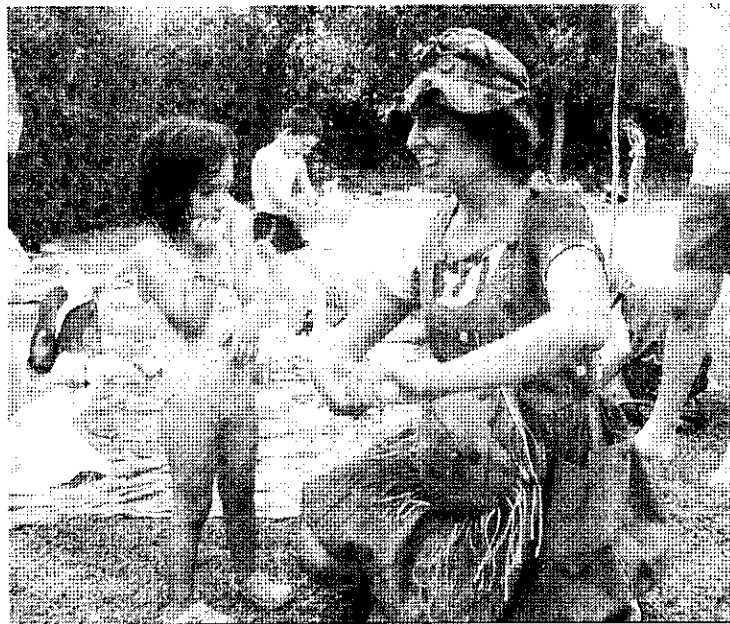
Multitud de juegos han hecho las delicias de los más pequeños.

Los talleres de cocina para los más pequeños, las sesiones formativas de Escuela de Familia dirigidas a padres y madres, los programas de radio y televisión sobre Alimentación y Hábitos de Vida Saludables, las jornadas de senderismo en familia, o las distintas gymkhanas han sido algunas de las actividades puestas en marcha a lo largo de este año por el Servicio de Atención a la Familia y la Infancia, que culminaron con este quinto encuentro que contó con la financiación de la Delegación Provincial de Igualdad y Bienestar Social, así como con el patrocinio de Cajasol, Almanatura, los Servicios Sociales Sierra Este, el